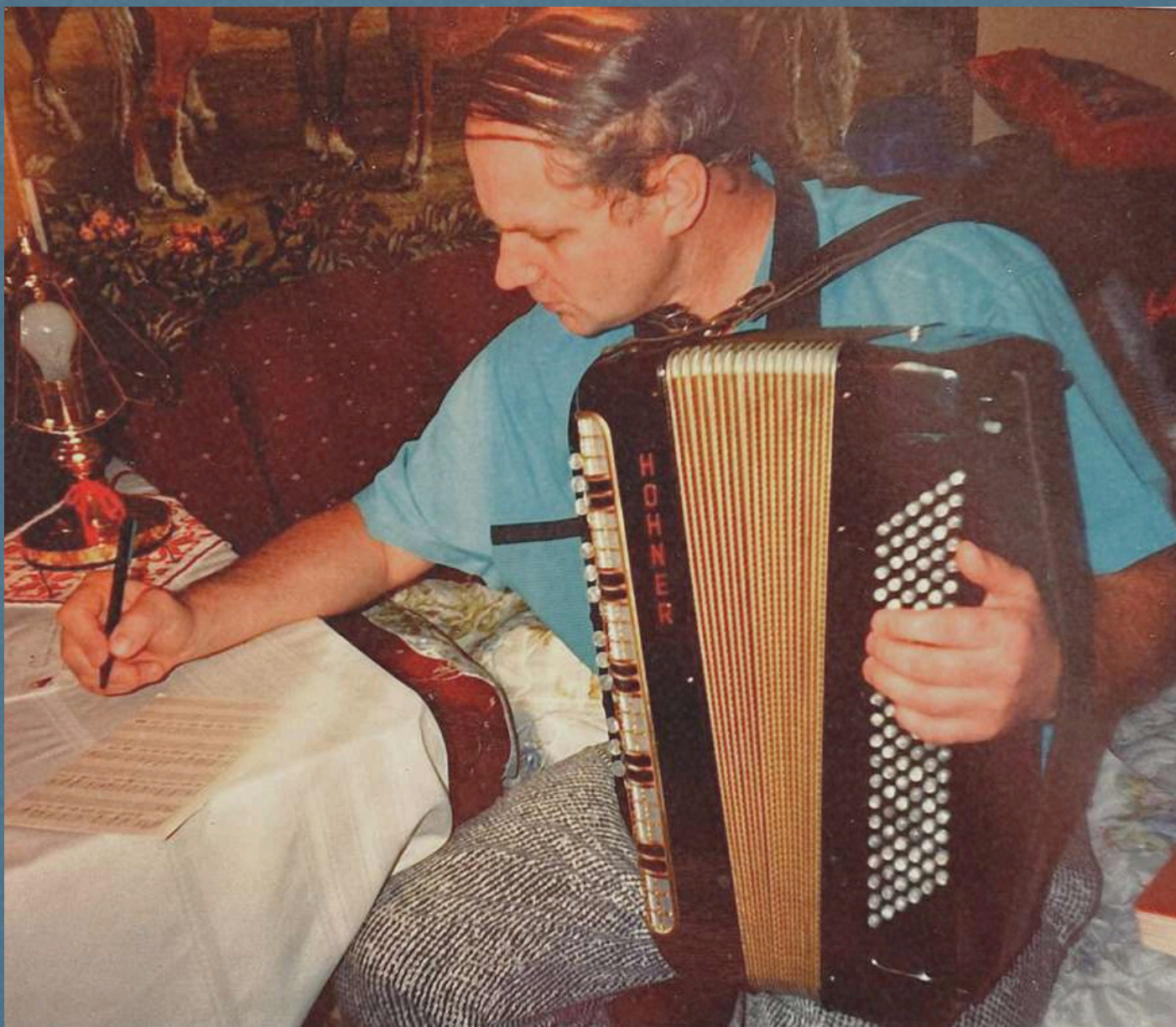
Написание псалма “Мы в жизни своей что-то сеем друзья”, 1993 Америка