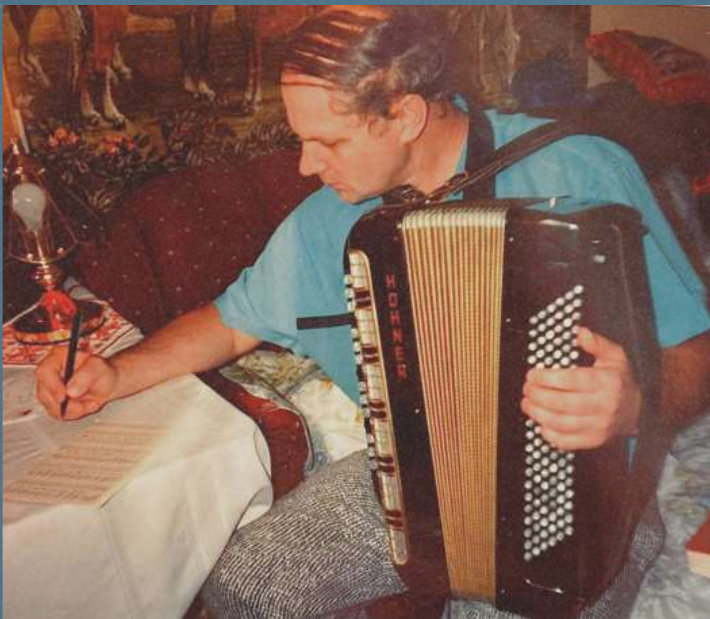
США, 20.05.93 - процесс написания псалма